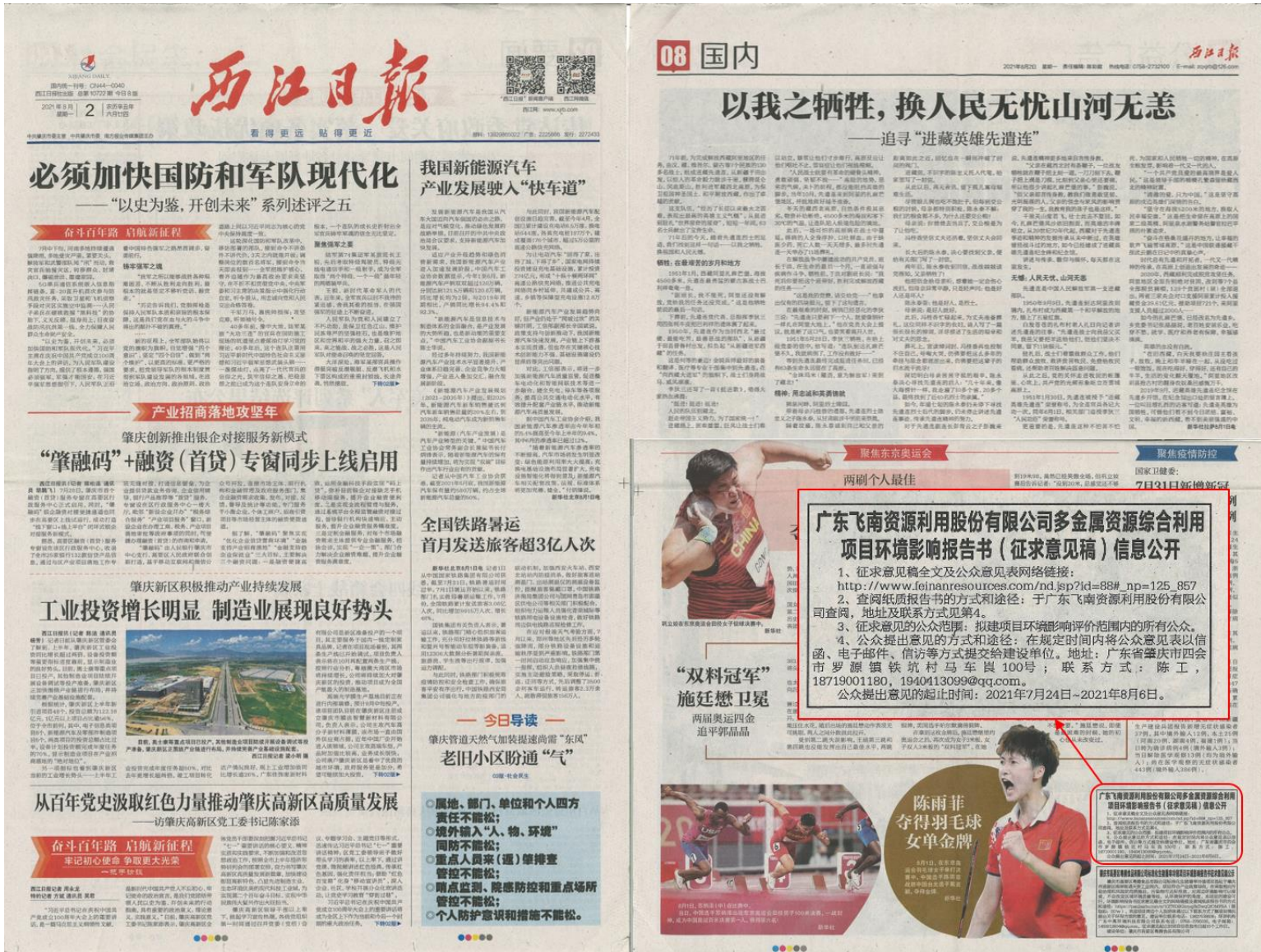
图 3-3 征求意见稿公示报纸公示照片（第 2 次）