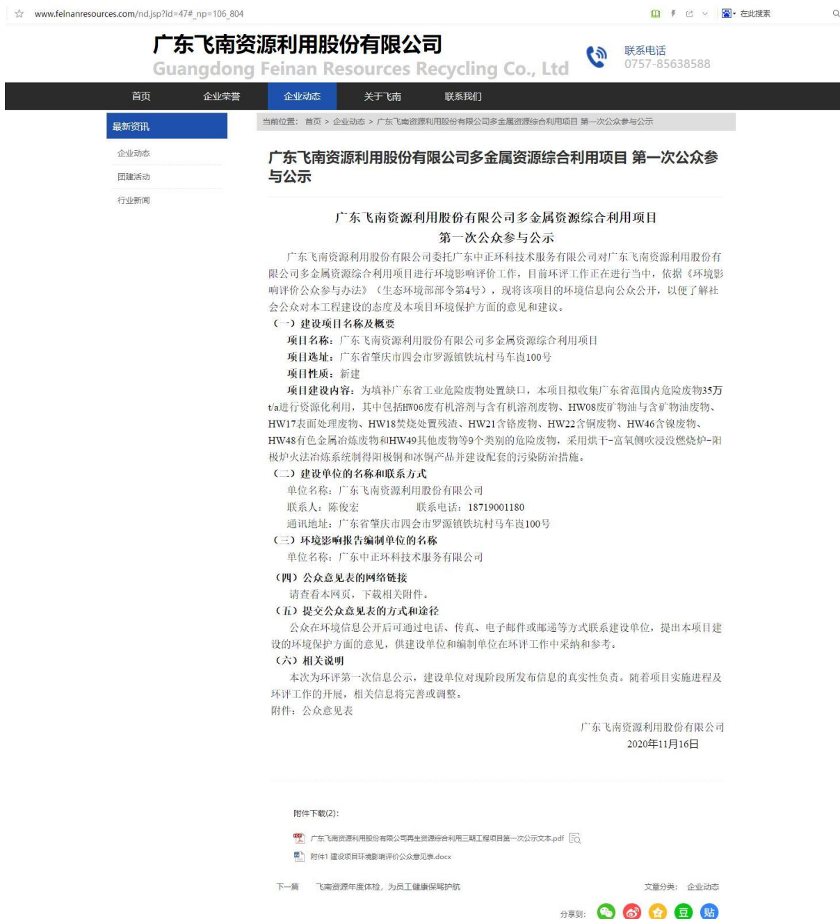
图 2-1 首次环境影响评价信息网络公示截图