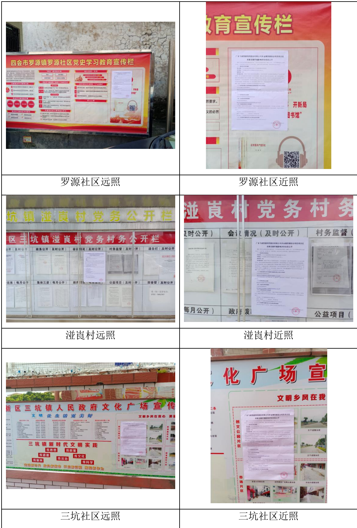
图 3-4 公众参与征求意见稿公开现场公示照片