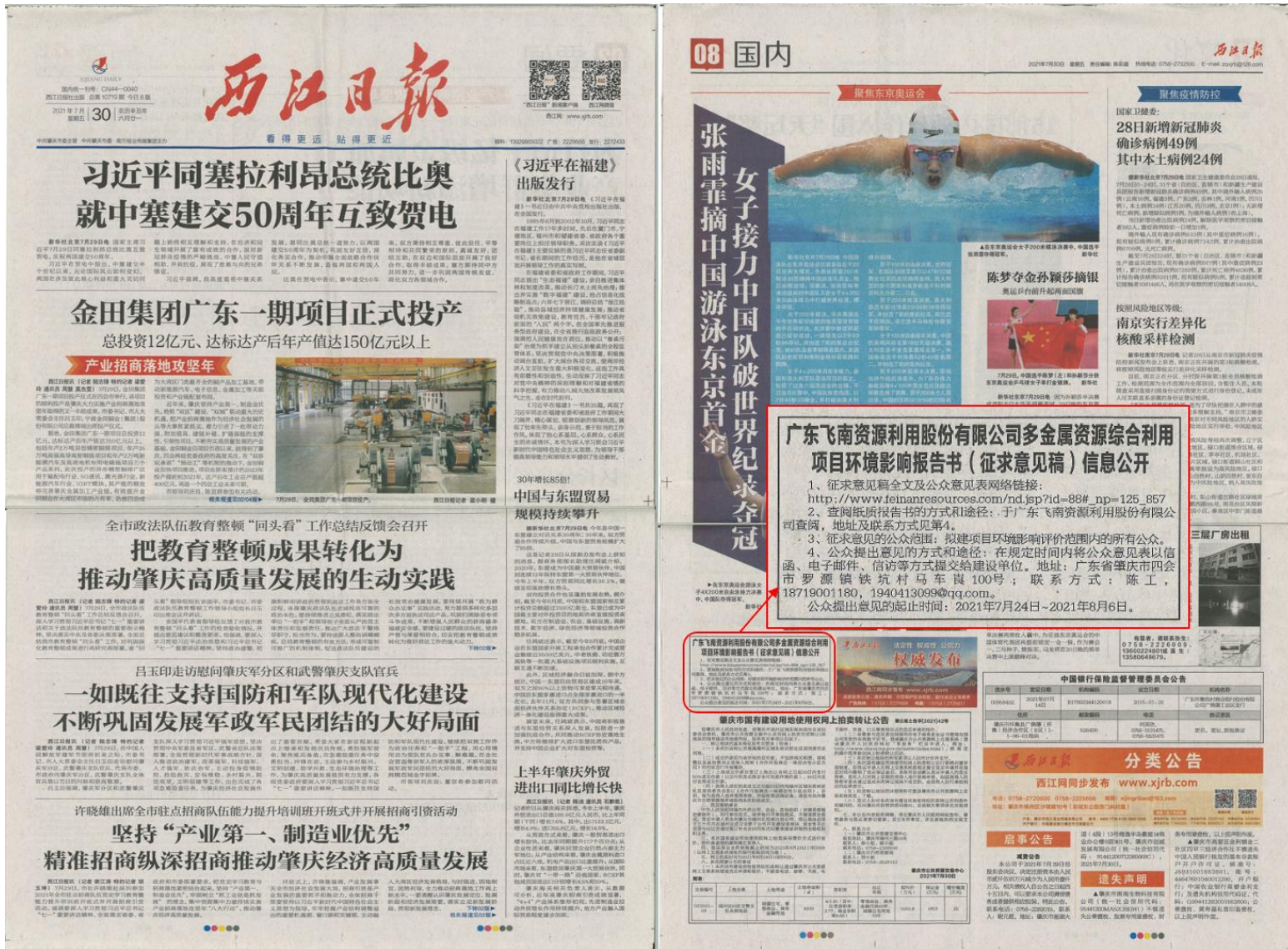
图 3-2 征求意见稿公示报纸公示照片（第 1 次）