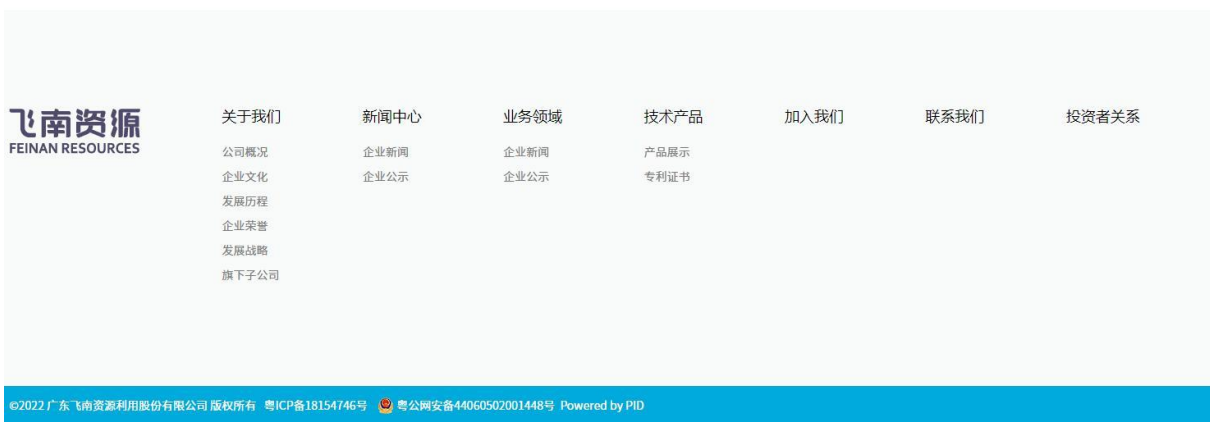
图 3-1 征求意见稿公示网络公示截图